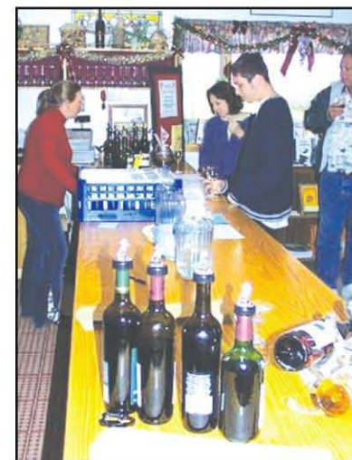
Bodega Alto Vineyards

El Illinois Department of Commerce and Economic Opportunity, Bureau of Tourism dirige los esfuerzos de la indus-