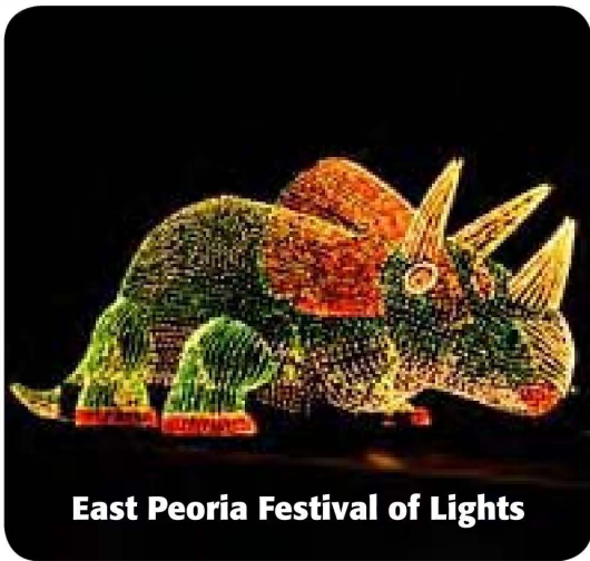
East Peoria Festival of Lights

Alrededor de Chicago existen una serie de lugares donde el espíritu de la Navidad está presente todos los días de diciembre.