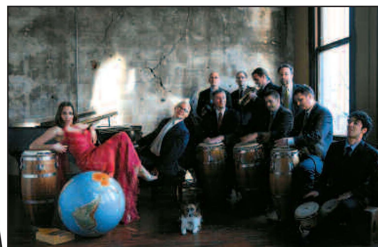
Pink Martini, Ravinia Festival

cen una variedad de comida a precios razonables. Ve a los toreros y payasos en la fiesta anual de Labor Day Festival & Roundup localizado al sur de Illinois en Palestine. Del 31 de agosto hasta el 3 de septiembre, podrá disfrutar de un rodeo en vivo con toros y payasos, los boletos cuestan 16 dólares por persona. Para entretenimiento gratis, puede participar en una variedad de actividades de fin de semana, incluyendo el desfile del Día del Trabajo.