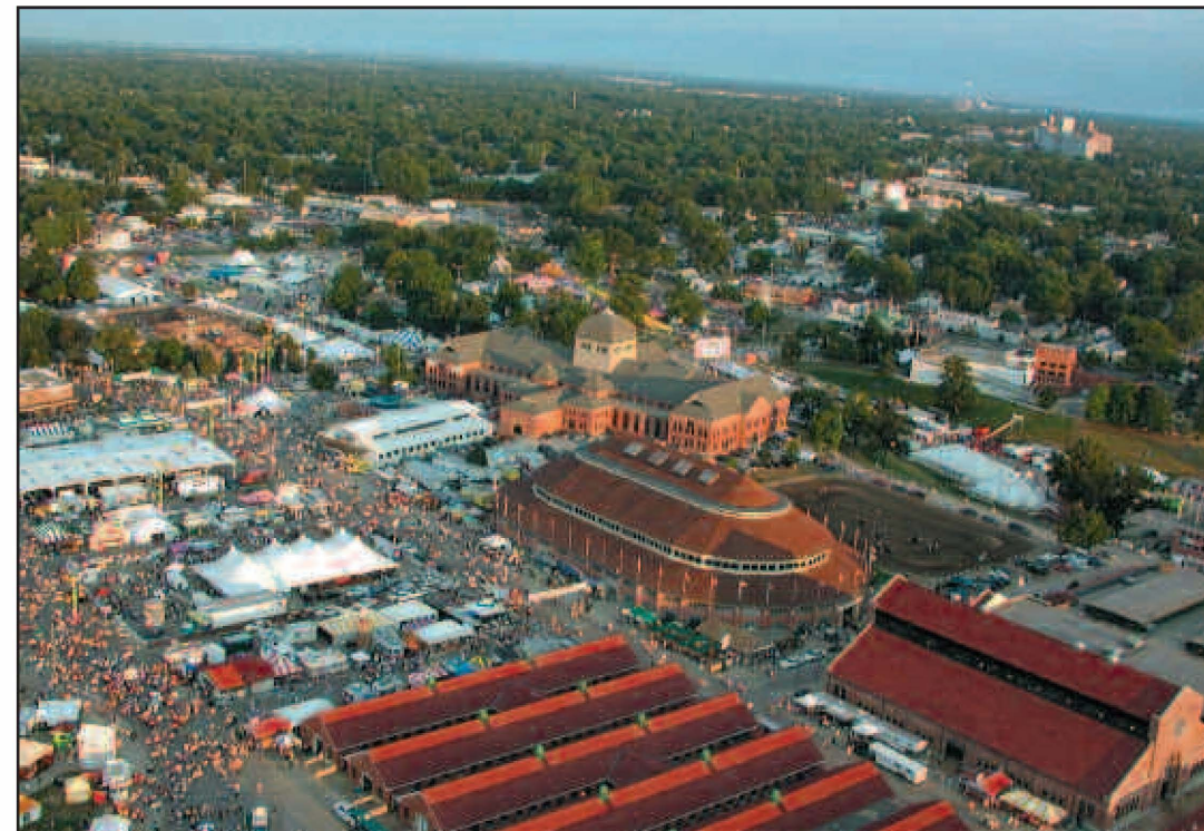
Feria Estatal de Illinois en Springfield. Illinois State Fair in Springfield

To get started on planning the perfect summer vacation, travelers can request a free copy of the new ¡Vive la emoción! brochure, find additional information or book a travel package through the Illinois Bureau of Tourism's Spanish-speaking travel professionals at 1(866) 610-GOZA or its website, www.disfrutailinois.com.